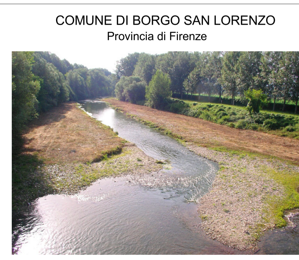
COMUNE DI BORGO SAN LORENZO Provincia di Firenze